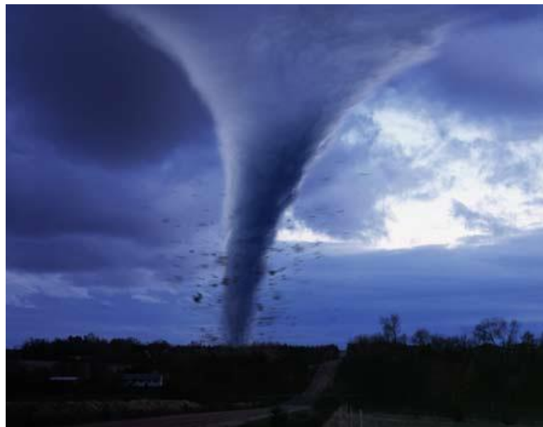
Рис. 4.3 Разные примеры тропических циклонов (торнадо).